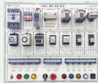
▶ MSN-RQ450(가방형 DC 제어)