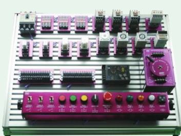
▶ MSN-RQ220(클램프 형)