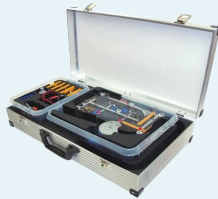
▶ 수력 에너지 (1905)