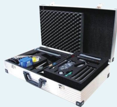
▶ 바이오 에너지 (1703)