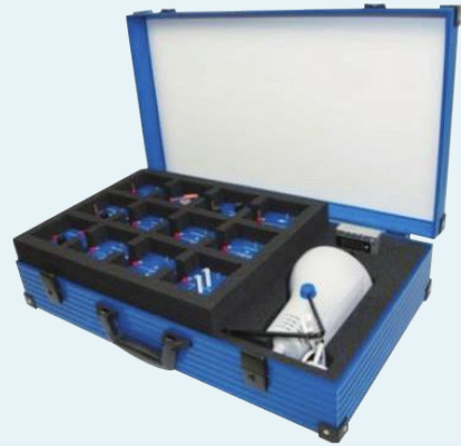
▶ 태양광 에너지 A (1118)