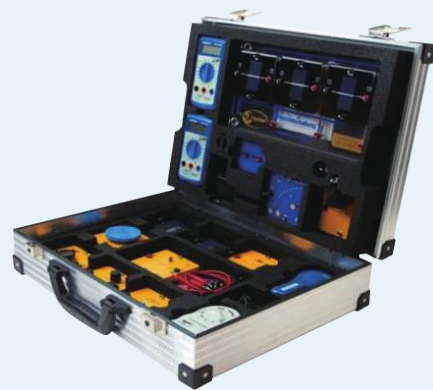
▶ 태양광 에너지 B (1105)